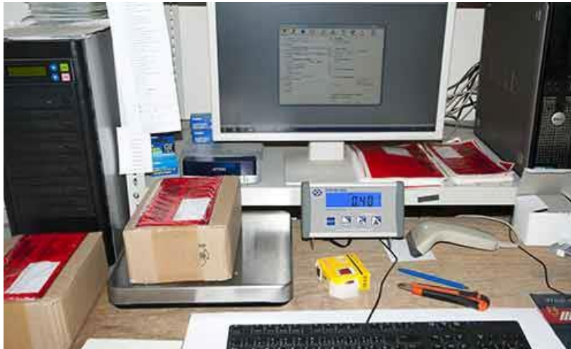
Aansluiting van de USB pakketweegschaal op de verzendsoftware van GePard / EasyLog / DHL.