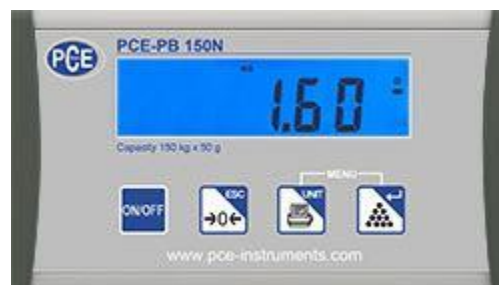
Beeldscherm van de USB pakketweegschaal van de serie PCE-PB N