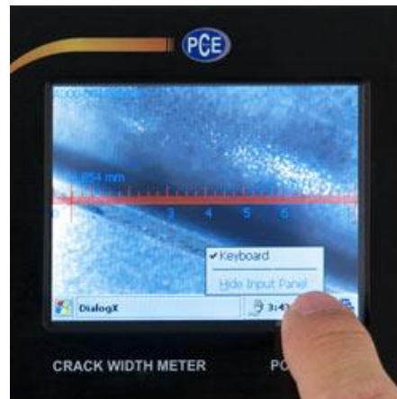
De scheurmeter PCE-CWM 20 met Touchscreen.