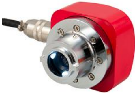
De Meetsonde van de scheurmeter PCE-CWM 20 met belichting