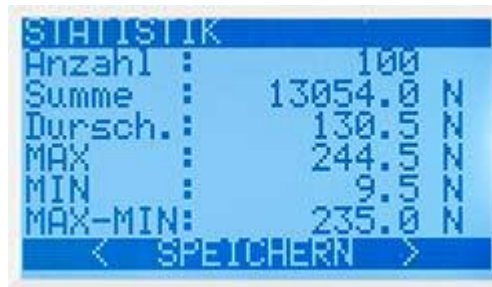
8 voorinstellingen met individuele kenmerken en elk 800 metingen in precisie krachtmeter