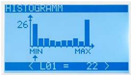
Vertegenwoordiging van de frequentieverdeling in de precisie krachtmeter PCE-FB-serie