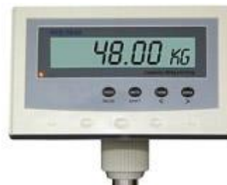
Jumbo-beeldscherm van de pakketweegschaal aan een instelbaar statief-hoofd (draaibaar)