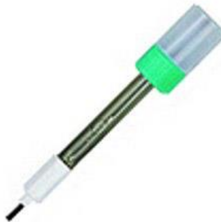
Hier ziet u de bij de zending behorende pH-elektrode voor de pH-meter PCE-PHD 1