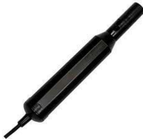
Hier ziet u de optioneel verkrijgbare zuurstofsensor voor de pH-meter PCE-PHD 1