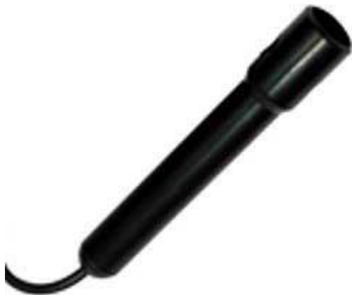
Hier ziet u de bij de zending behorende geleidbaarheidselektrode voor de pH-meter PCE-PHD 1