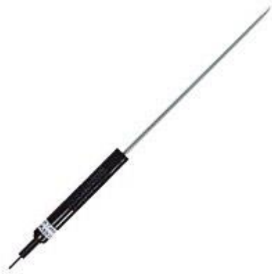
Hier ziet u de optioneel verkrijgbare temperatuursensor voor de pH-meter PCE-PHD 1