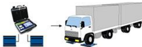
Wielweging met Weegbrug