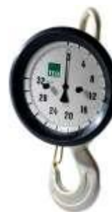
Mechanische Kraanweegschaal met ring en haken (vorm 1)