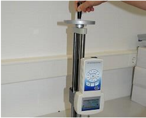
Kracht testbank: Procedure via handwiel