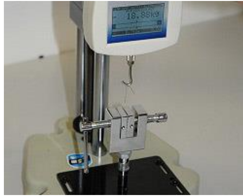
Kracht testbank: Aflezing van de maximale kracht.