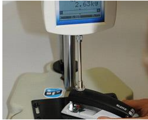
Kracht testbank: Controle van de meetresultaten