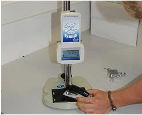
Kracht testbank: Uitvoering van de meting