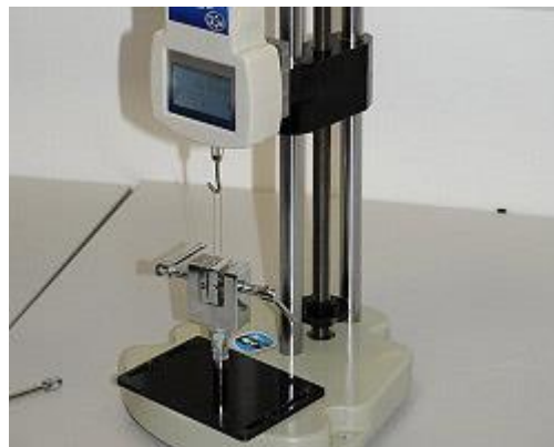
Kracht testbank: De trekproef wordt gespannen.