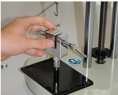
Kracht testbank: Voorbereiding van de meting