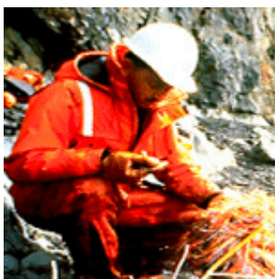
De geigerteller wordt voor meting van natuurlijke