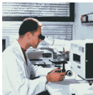
Wordt ook in het gebied van onderzoek gebruikt.