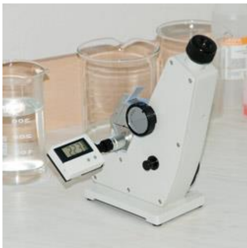
Abbe-refractometer in gebruik