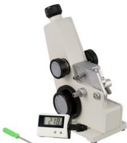
Leveromvang van de Abbe-refractometer