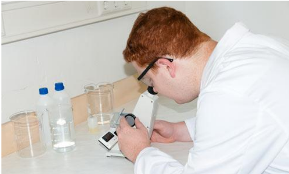
Laborant aan het werk met de Abbe-refractometer