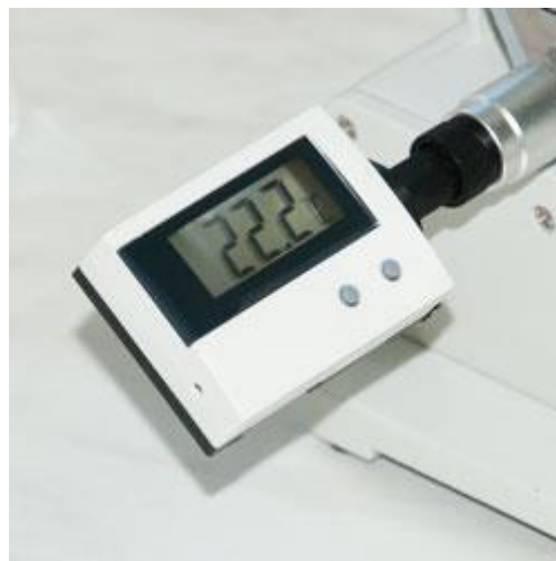
Abbe-refractometer met een thermometer om de correcte brekingsindex te berekenen